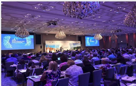
Крис Хил, директор на ESHA, с приветствено слово

Събитието, провело се между 19 - 21 май, събра над 450 учени, изследователи, представители на организации с интерес в областта на образованието и лидерството от цяла Европа. Темата на конференцията беше “Училищно лидерство 2020+: Тенденции и предизвикателства”.